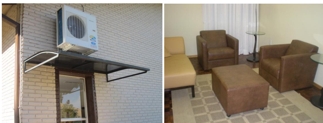
Sede social: Nova aba de cobertura e sofás no banheiro feminino receberam novo revestimento