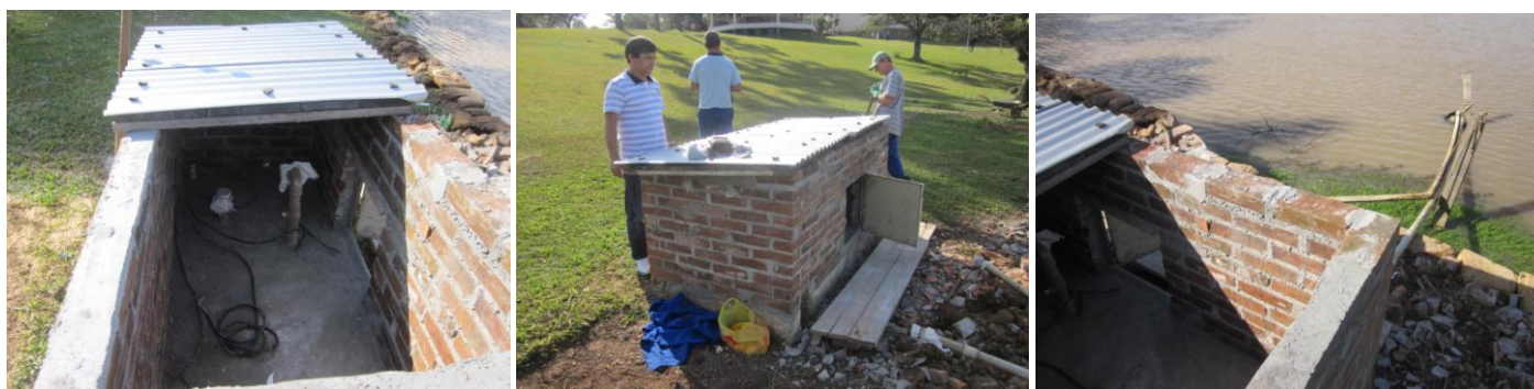
Motores/bombas de água (irrigação/chafariz) receberam nova proteção