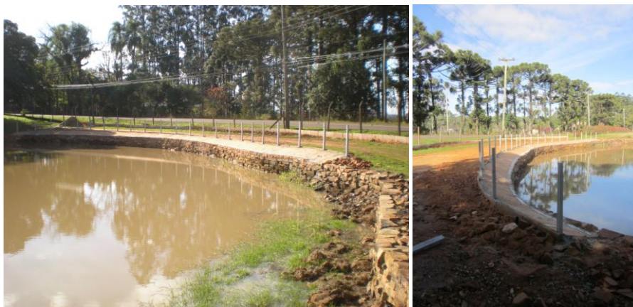
Lago: Obra em andamento