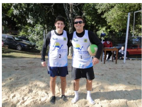
Leonardo e Rafael