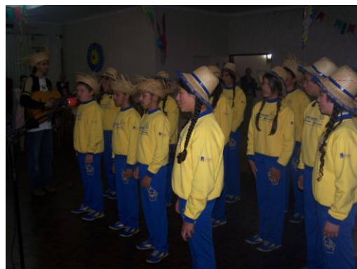
Coral Infantil AABB Comunidade