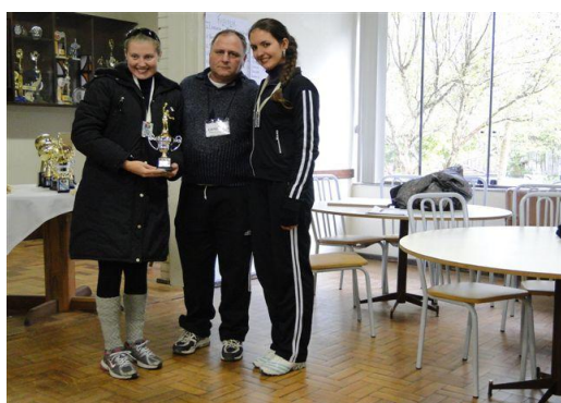
Segundo Lugar Vôlei Fem.