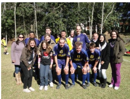
Time com a torcida