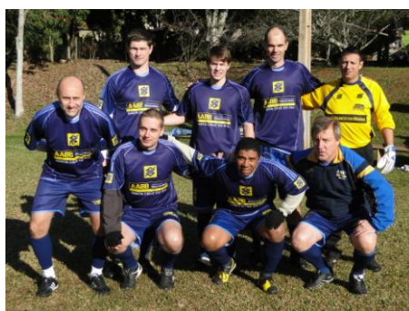
Equipe do Futebol