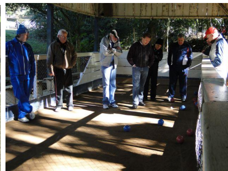
Equipe da Bocha