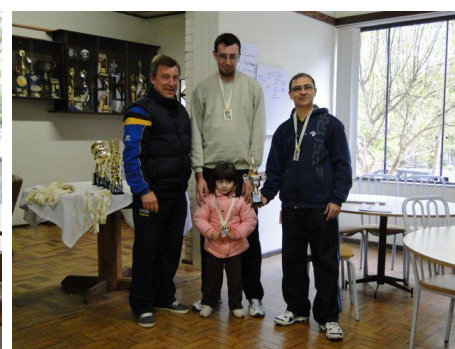
Primeiro Lugar Vôlei Masc.