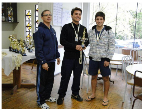
Segundo Lugar Vôlei Masc.