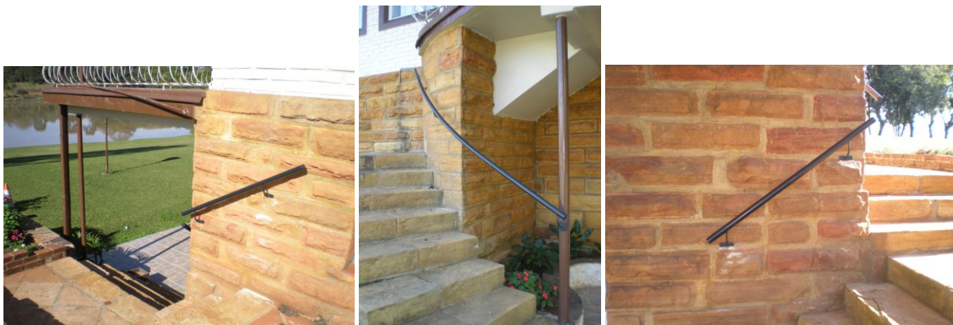
PPRA – Plano de Prevenção de Riscos Ambientais