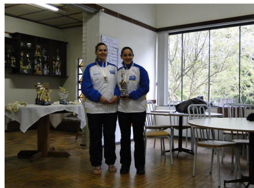
Primeiro Lugar Vôlei Fem.