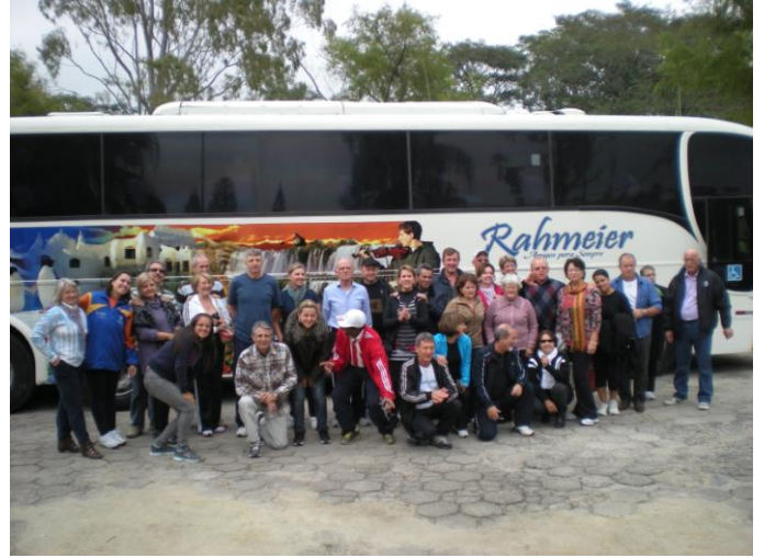
Associados voltando para Santa Cruz