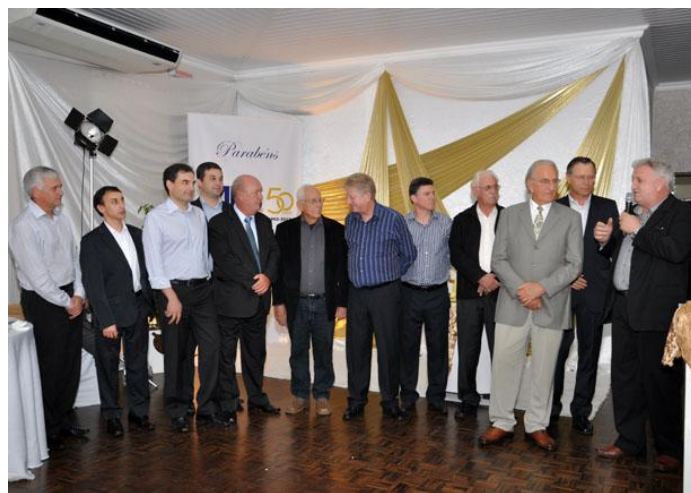
Administradores do Banco do Brasil homenageados.