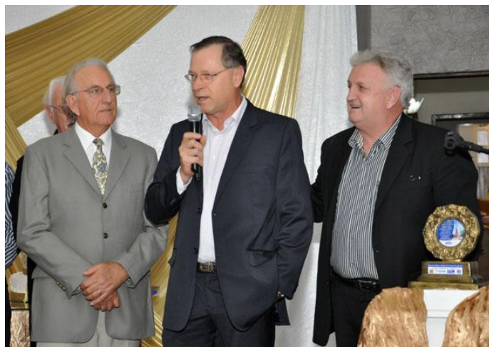
Homenagem CESABB ao BB/Ag. 0180-5 p/seus 70 anos.