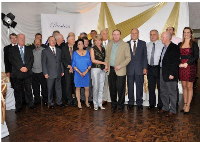
Presidentes da AABB homenageados.