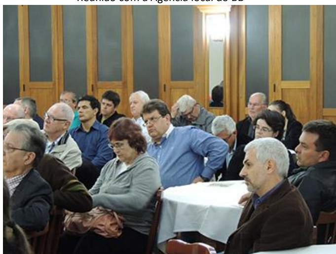
Funcionários do BB (da ativa e aposentados) em reunião/jantar - Debate estágio atual das negociações com CASSI