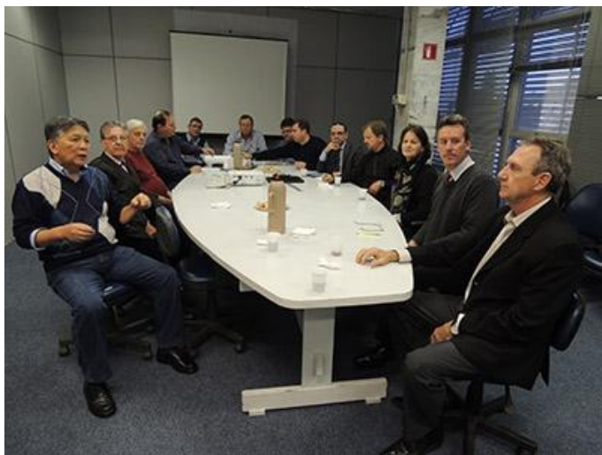
Reunião com a Agência local do BB