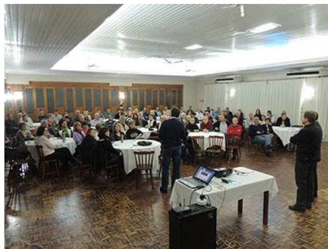
Palestra Sergio Riedi