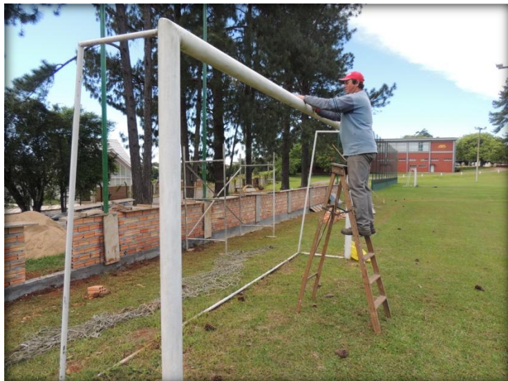
Pintura e renovação das redes.