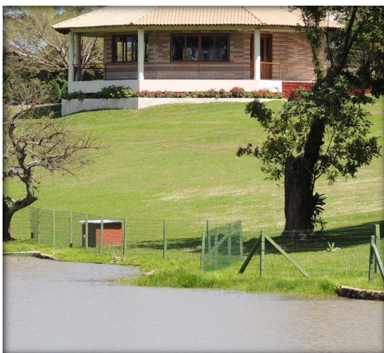
Colocação de 600 metros de cerca.