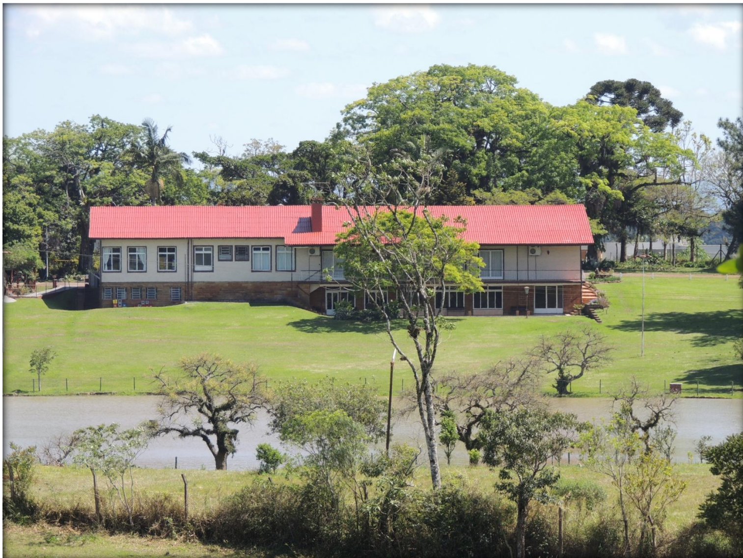
Lavagem e pintura do telhado.