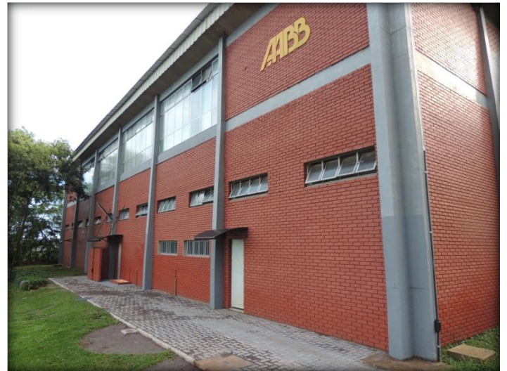
Colocação de toldos e piso.