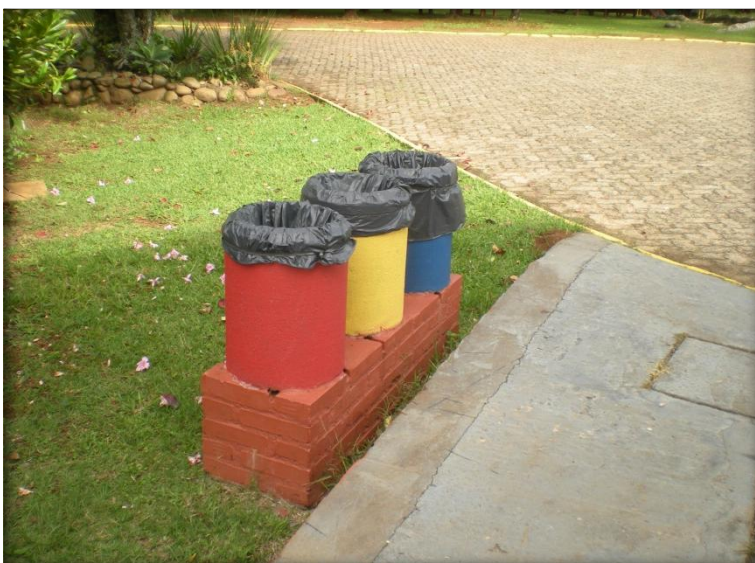
Colocação de Lixeiras.