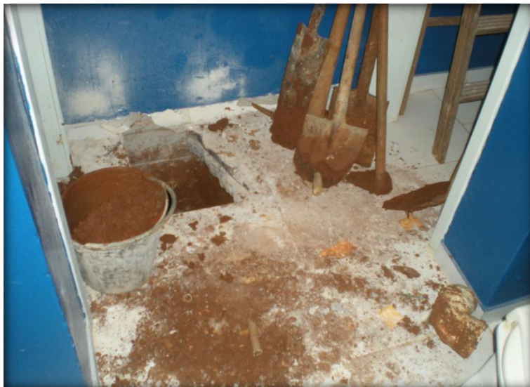
Revisão de Banheiros.