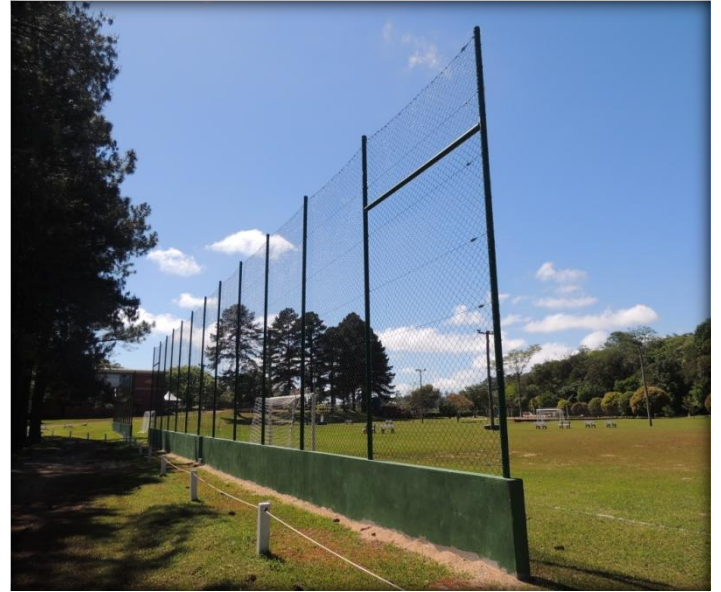
Construção de muro e colocação de cerca.