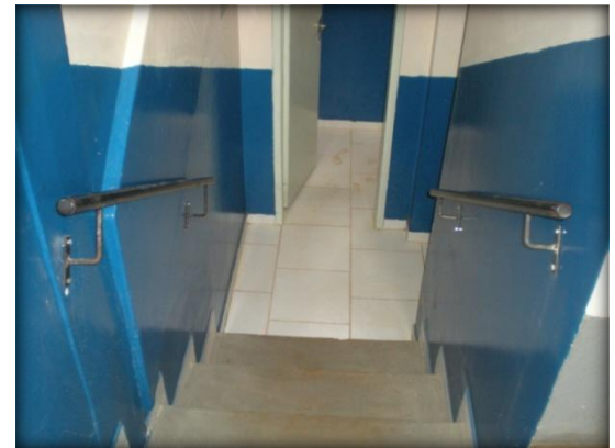
Colocação de um púlpito, placas e corrimão.