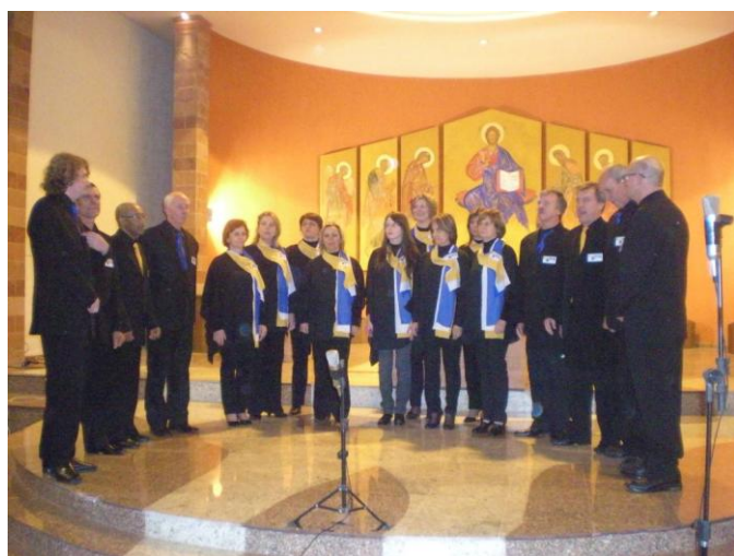
Coral AABB Santa Cruz do Sul

Formado por associados do clube e pessoas de nossa comunidade, o coral realiza anualmente cerca de 10 apresentações. Realizou seu primeiro ensaio no dia 15 de maio de 2002, nasceu do amor pela música e a vontade de cantar.