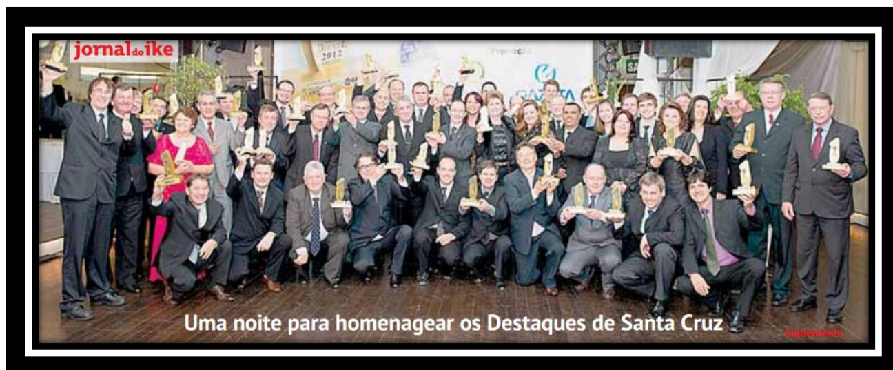
Uma noite para homenagear os Destaques de Santa Cruz