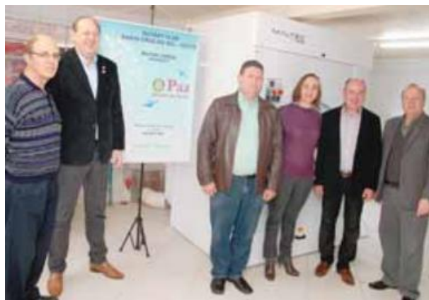
Investimento de R$23 mil