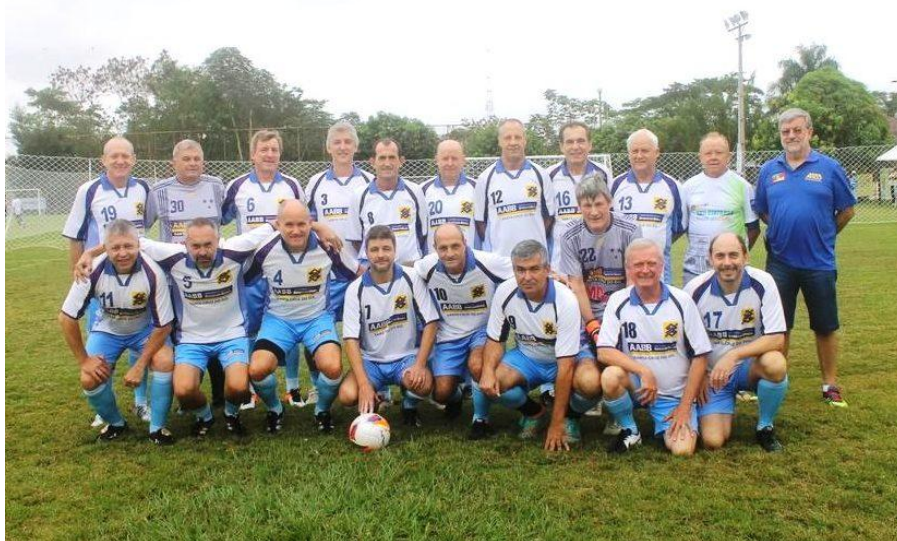
Equipe Bi-Campeã Brasileira Master