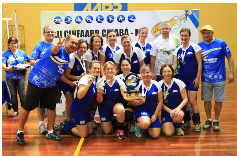
3º lugar (pelo critério desempate - Sets Average)